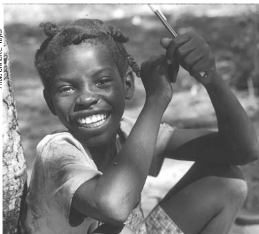
Une jeune étudiante Angolaise au camp de Nangweshi, en Zambie.

Un communiqué de l'UNHCR a précisé que, parmi ce nombre, 46 000 Angolais avaient regagné le pays grâce au Programme de rapatriement volontaire organisé et 38 300 autres avaient regagné leur patrie spontanément. Selon la même source, 507 Angolais sont rentrés au pays entre le 2 et le 6 juillet dernier, à travers les régions de Luau et Kimpese (nord-est de l'Angola).