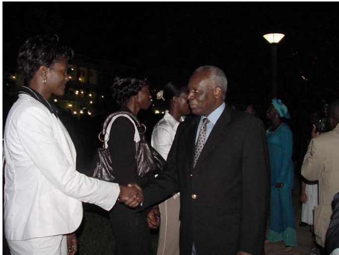
Les athlètes angolaises saluées à leur retour au pays par le président José Eduardo dos Santos et la Première Dame.

Chez les hommes, grâce à sa victoire devant l'Algérie (31-30), l'Angola a terminé troisième place, assurant ainsi sa participation au prochain championnat mondial, prévu en Tunisie en 2005. Avec ce résultat, les Angolais ont battu leur propre record. Lors de la finale masculine, l'Égypte s'est imposée face aux favoris algériens. C'est la troisième fois, après